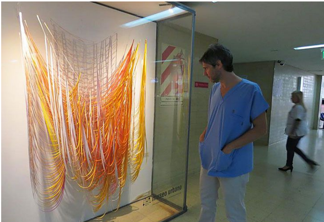
Itinerante. El colectivo Museo Urbano va mudando las obras.